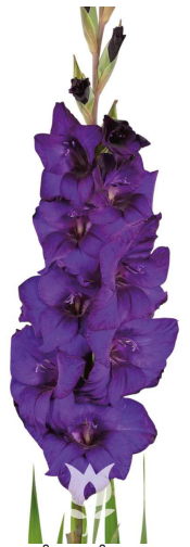
F23 パープルフローラ