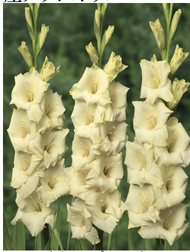
F22 クリームパーフェクション