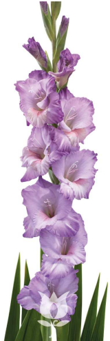
F25 フレボノルティカ