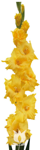
A01 フレボフリーザー