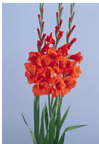
D01 ハンティングソング