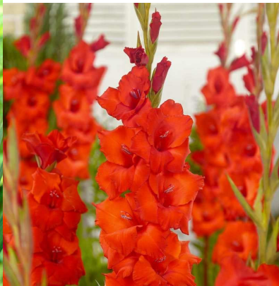
F08 タドール デ パン