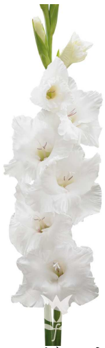
F20 フレボエスキモー