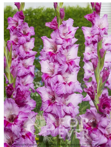
E09 エクスピリエンス