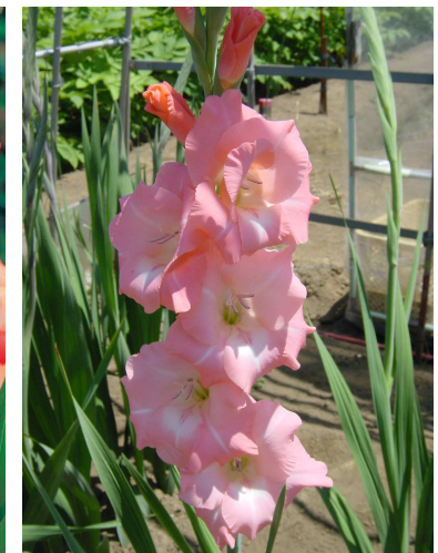
F13 フレボエフェクト