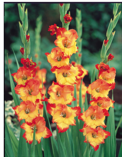
D08 プリンセスMローズ