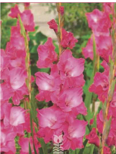
B07 フェアリーテイルピンク