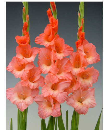
F15 スピックアンドスパン