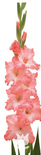
C05 フレボフュージョン