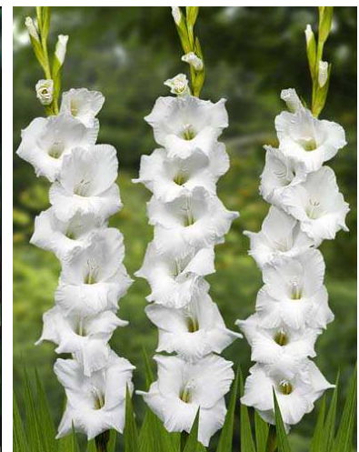
F17 アレクサンダーザグレート