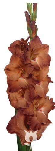
C1 インディアンサマー