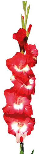
F29 ビーチパーティー