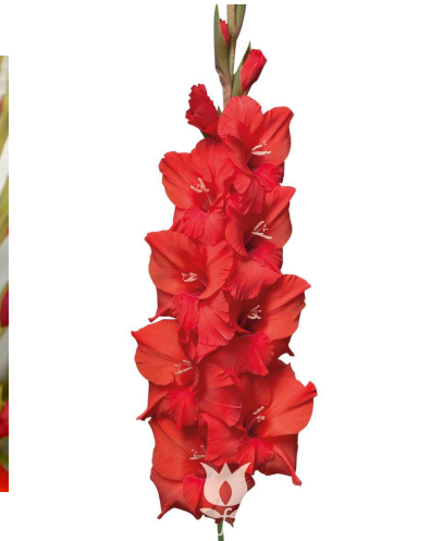
F09 ロジービーレッド