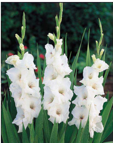
F16 ホワイトプロスペリティー